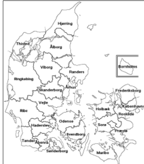
1 - Denemarke

Dominicus Preis, 'n boorling van Praag, 25 jaar oud het vir burgerskap gevra en is dit gegee as 'n Meester bouer, hy het 'n belofte gemaak en die arm man het belowe om 1Rd. per jaar in dankbaarheid aan die stad te gee vir die 6 vryheid jare tot 60Rd. 11