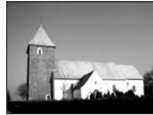
2 - Framlev Kerk