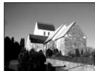
4 - Skødstrup Kerk